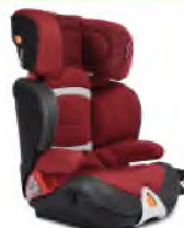
Автокресло группы III для детей массой 22-36 кг (возможно использовать безопорно)